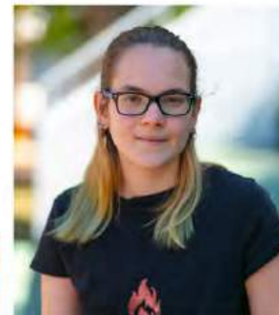
Whatever helps you sleep at night

Στο δημοτικό είσαι παιδί, στο γυμνάσιο προσπαθείς να συνειδητοποιήσεις ποιος είσαι ως άνθρωπος και ποιος ο ρόλος σου σε αυτόν τον κόσμο. Στο Λύκειο κρατάς την «ελευθερία» του ανήλικου ενώ έχεις μια καλή εικόνα της ταυτότητας σου, για εκείνη την στιγμή τίποτα δεν είναι μόνιμο ποτέ, αλλά και της ευθύνης. Για αυτό τον λόγο (ίσως συνέβαλε και μια πονδημία, τίποτα δεν είναι σίγουρο, ποτέ) το λύκειο είναι τα δυσκολότερα αλλά και τα καλύτερα χρόνια.. προς το παρόν.. και η ζωή συνεχίζεται.. όμορφα..